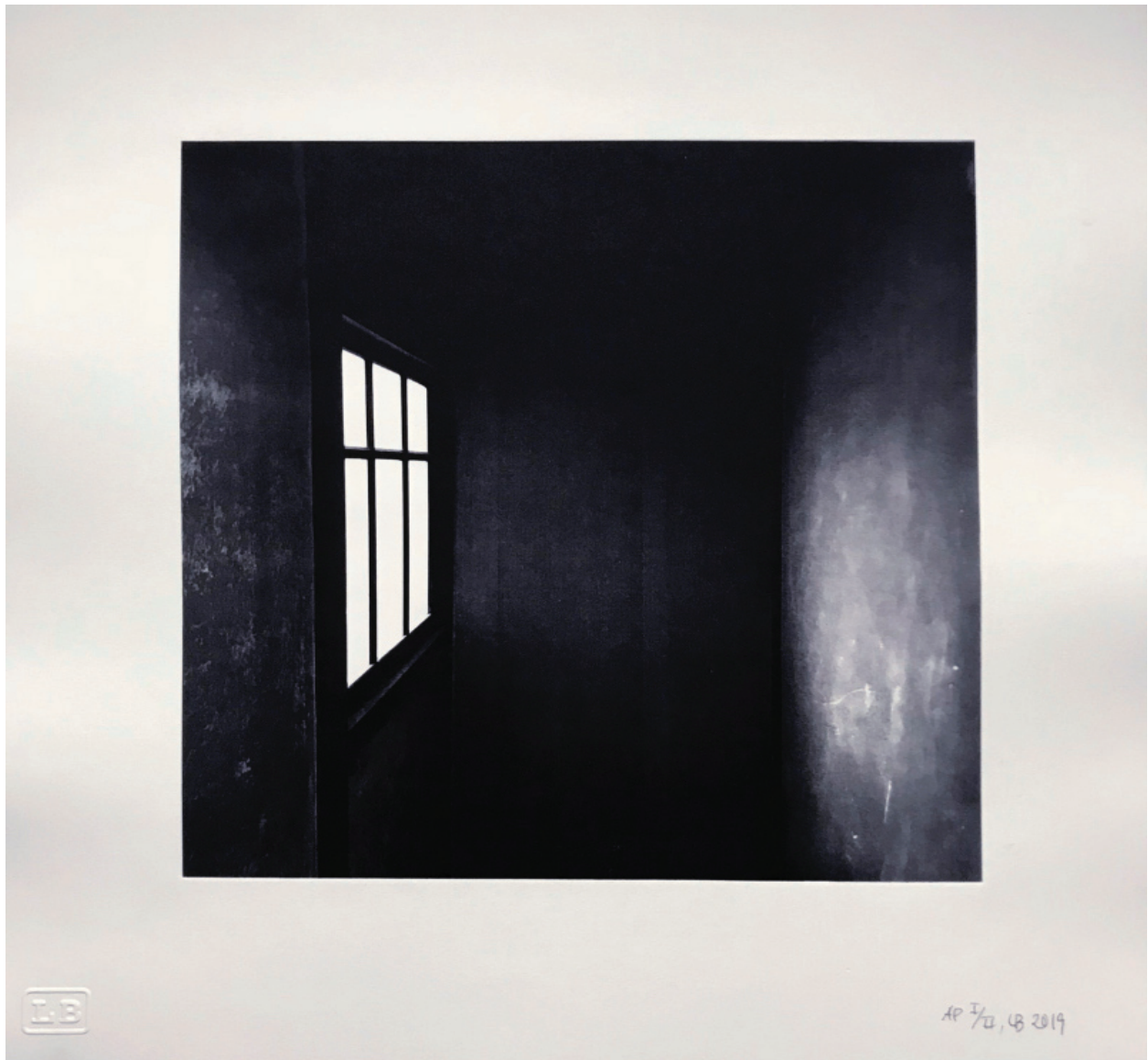
Nocturnal Notes VII ed. 3/25 værk nr. 9. Lene Bennike