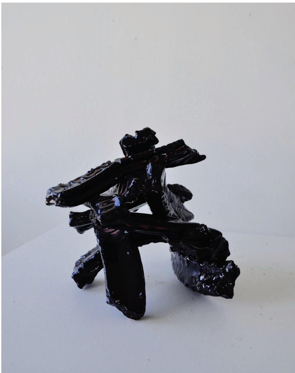
“Sign 4” værk nr. 42 Henrik Kramer Westergaard