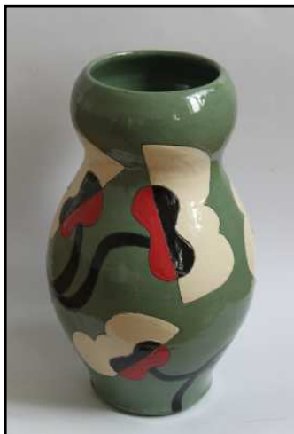
Susie Asbæk “Keramisk Krukke”