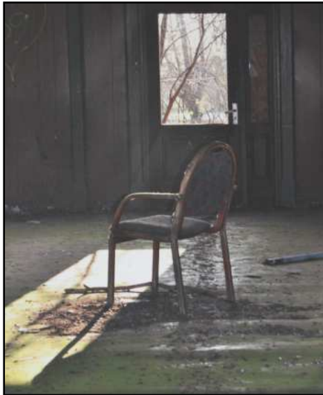
Grete Rolschau, Foto "Stolen"